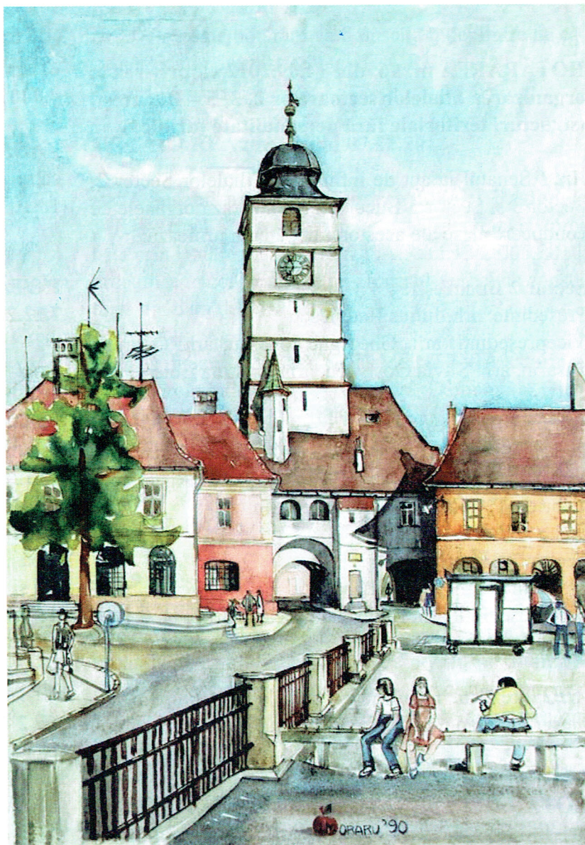
Acuarelă Turnul Sfatului - Piața Mică - Sibiu

Hotărâri Senat UAR Calendar ședințe Conturile pentru plata cotizațiilor