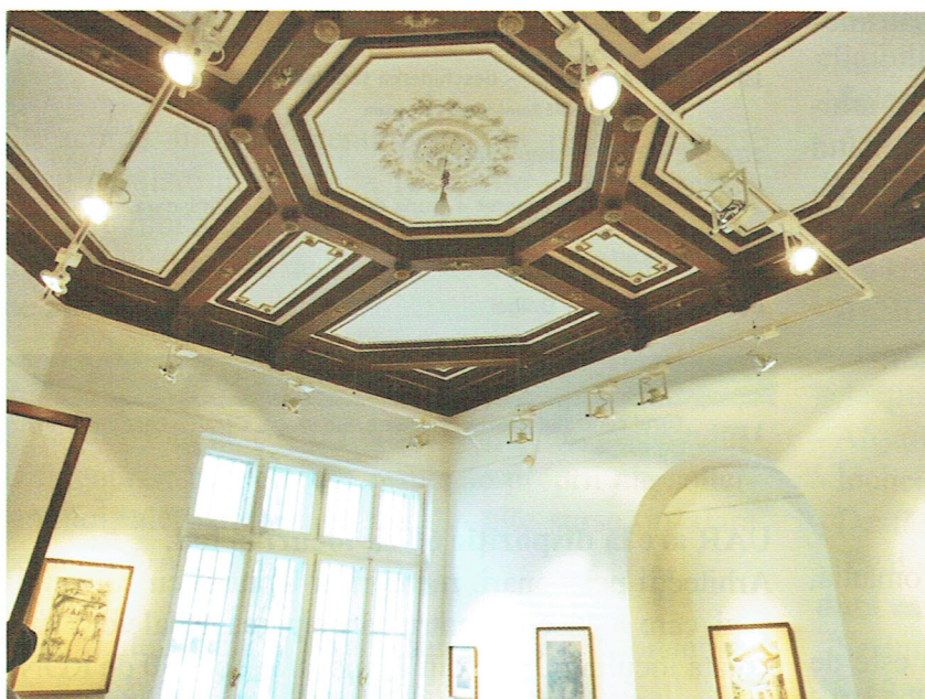
Poze interior Centrul de Cultură Arhitecturală al UAR