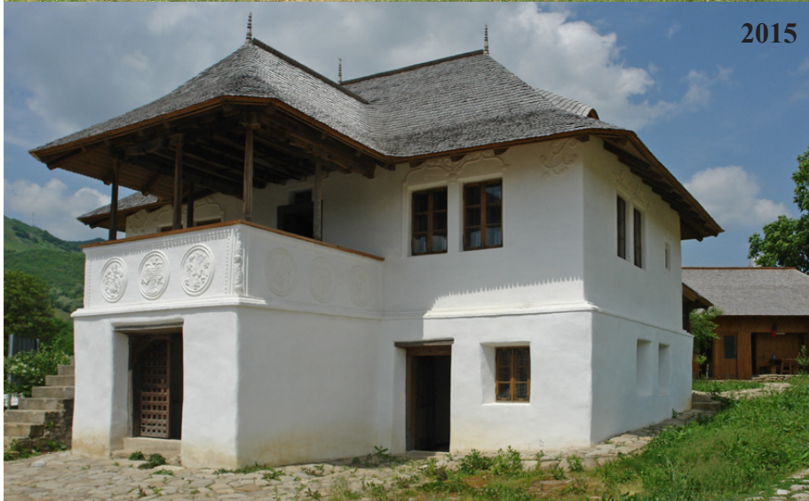
Casa cu Blazoane - Comuna Chiojdu, Sat Chiojdu, județul Buzău